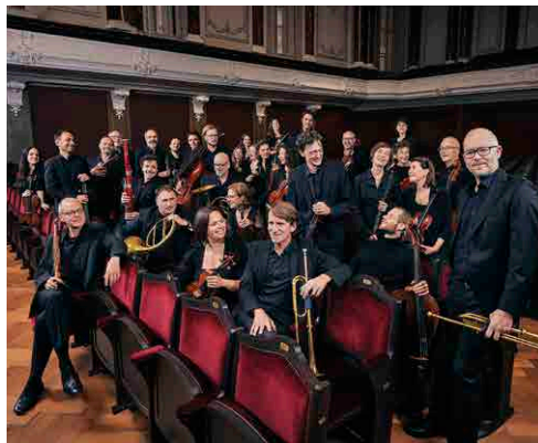
Komorni orkester iz Basla