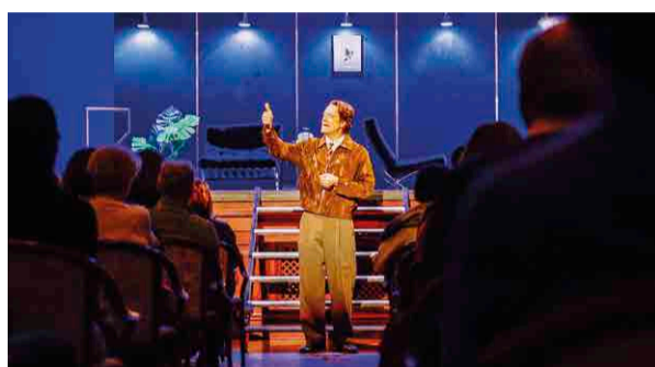
Agencija za razhode