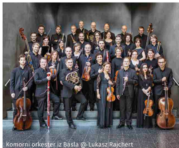
Komorni orkester iz Basla