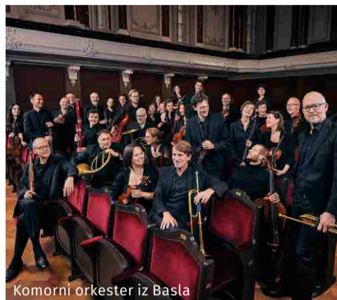
Komorni orkester iz Basla