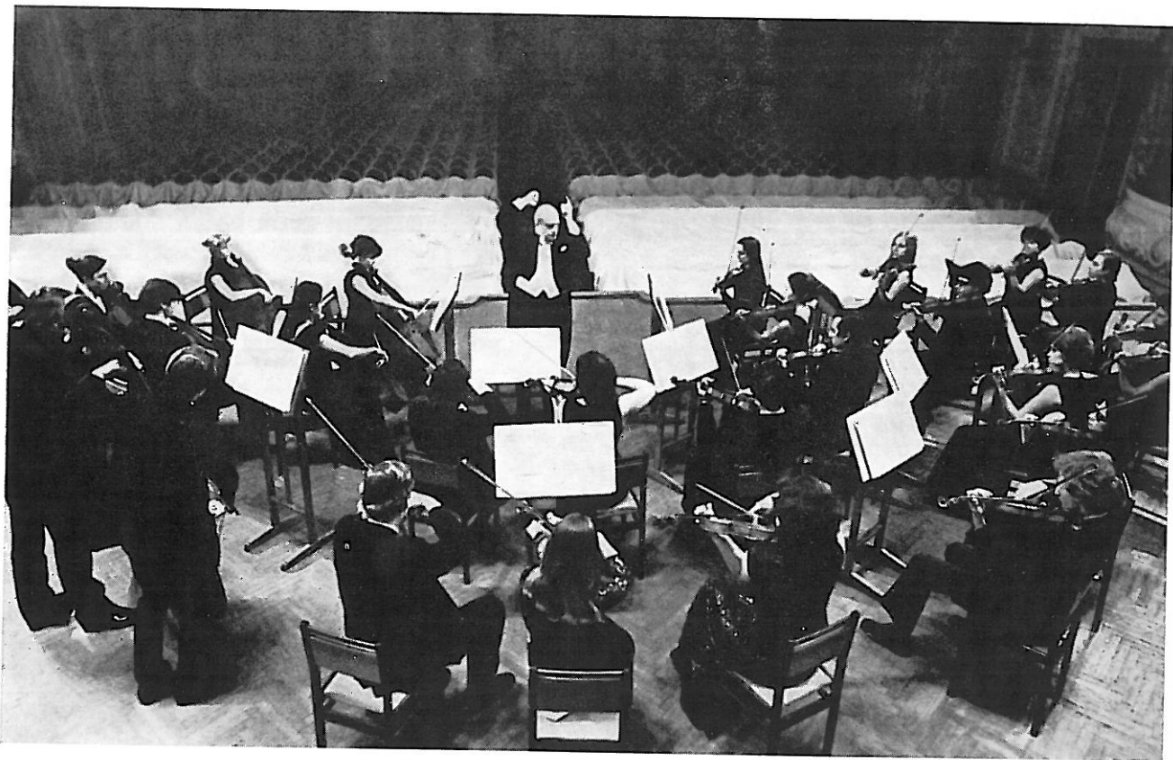
Komorni orkester Rudolf Baršaj iz Moskve