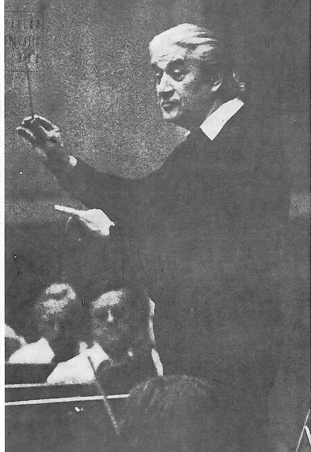
Sergiu Celibidache je dirigiral koncert Simfoničnega orkestra Radia Stuttgart, enega največjih umetniških dosežkov, ki smo jih slišali v tridesetih letih