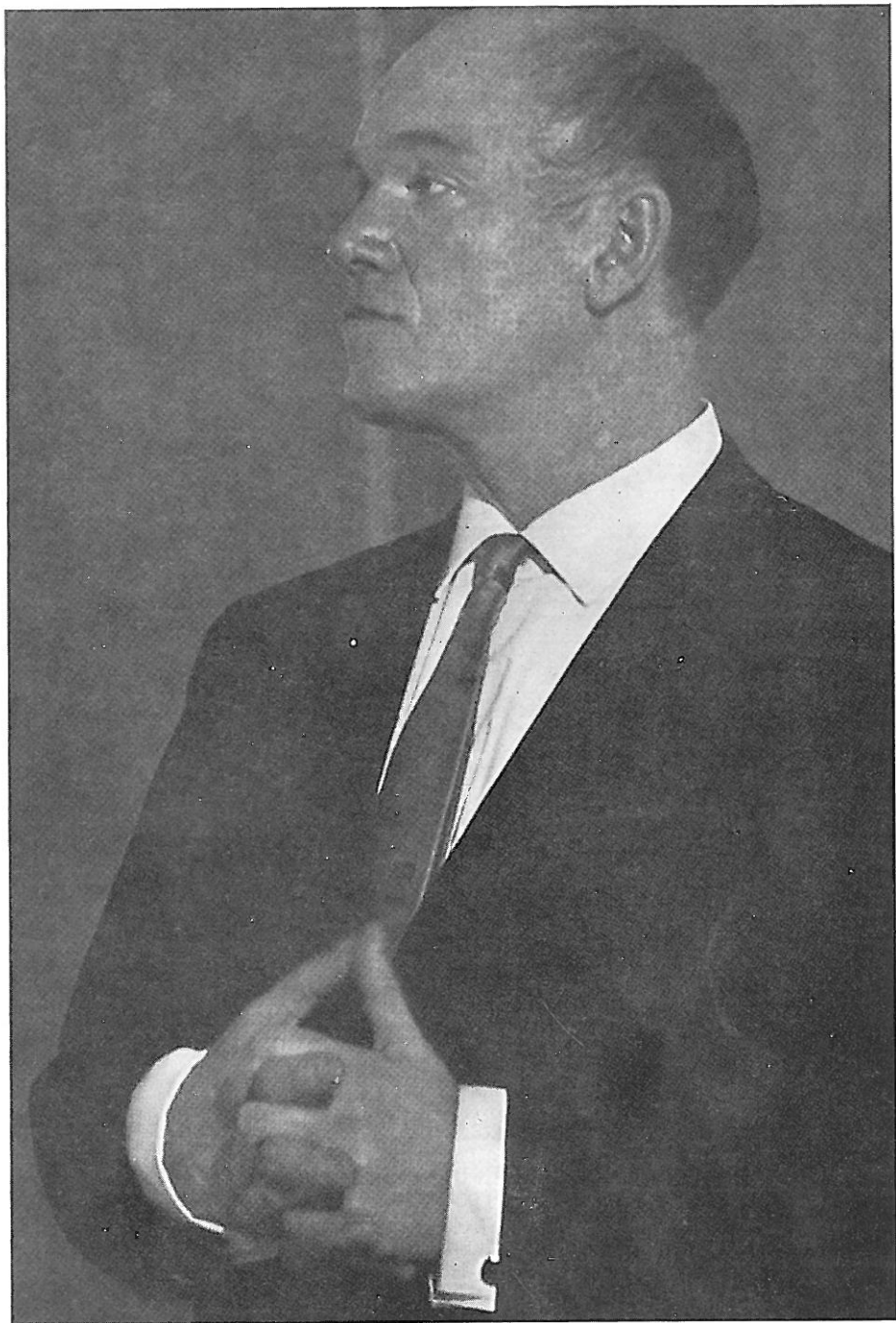
Eden najpomembnejših koncertnih dogodkov v Mariboru je bil nastop pianista Svjatoslava Richterja