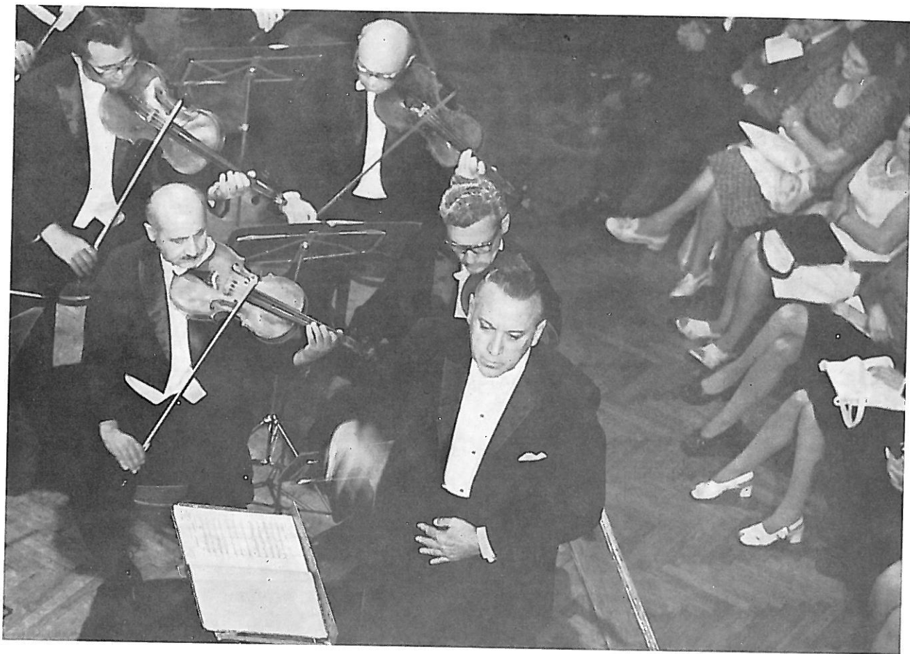
Moskovska filharmonija pod vodstvom Kirila Kondrašina