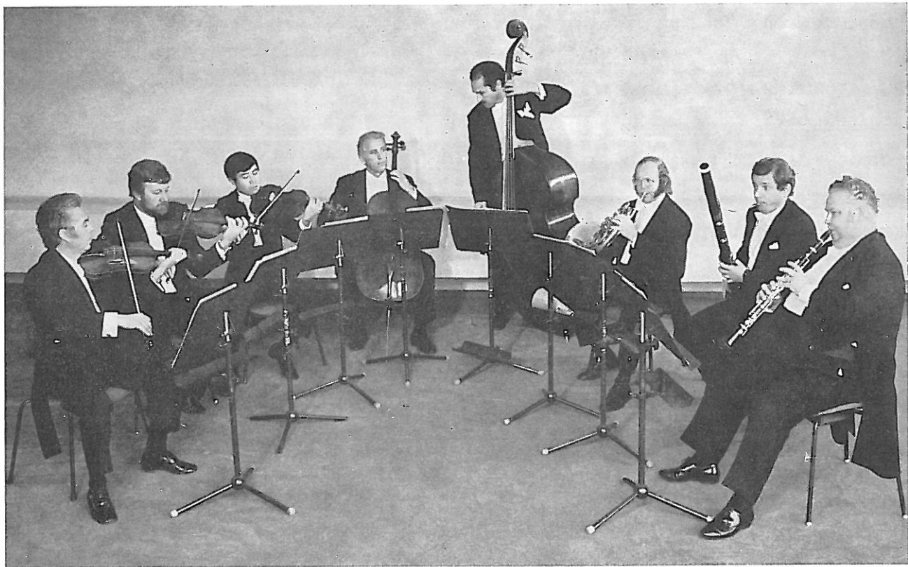
Oktet Berlinske filharmonije