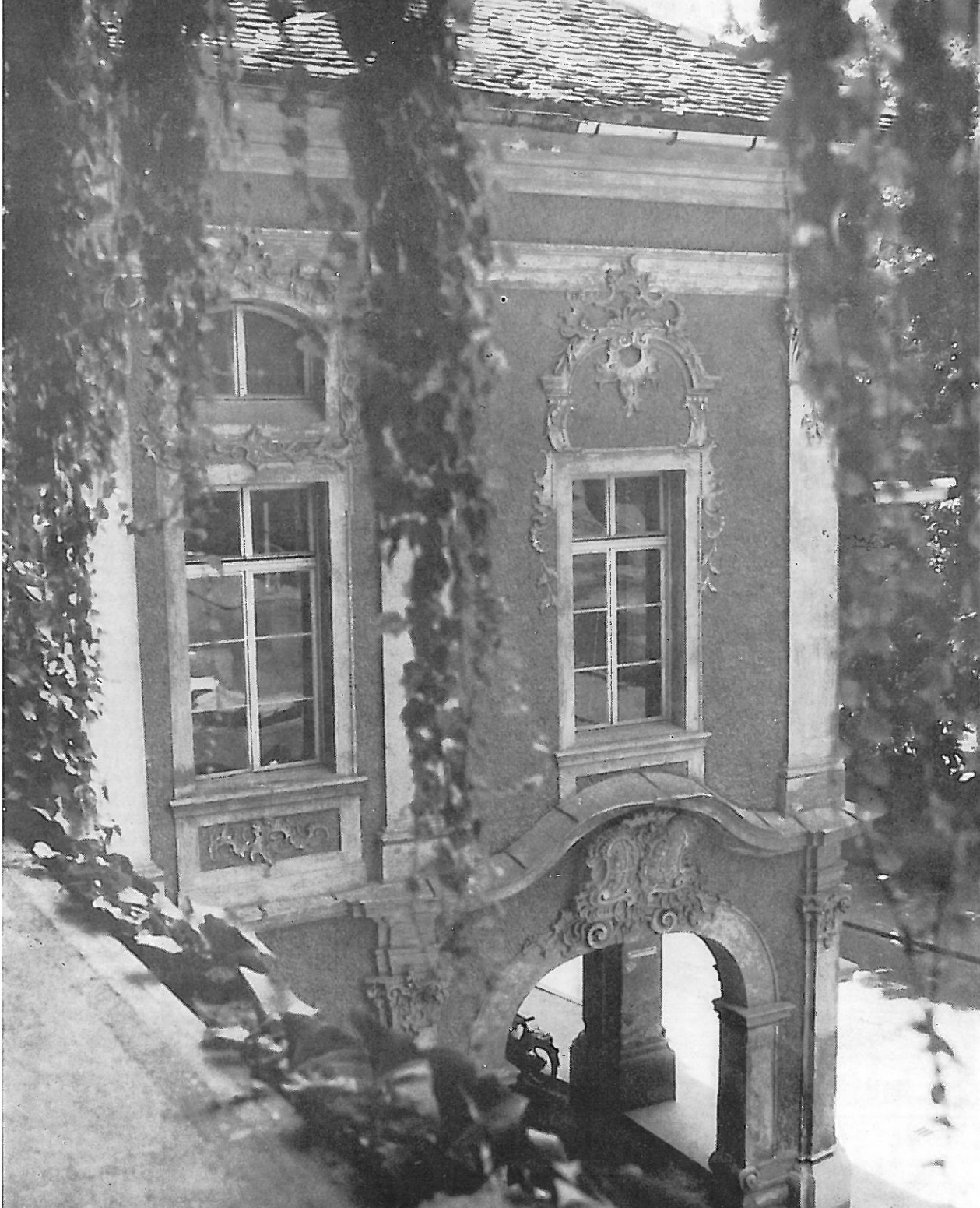
Mariborski grad, v njem se odvija vsakoletni Festival baročne glasbe