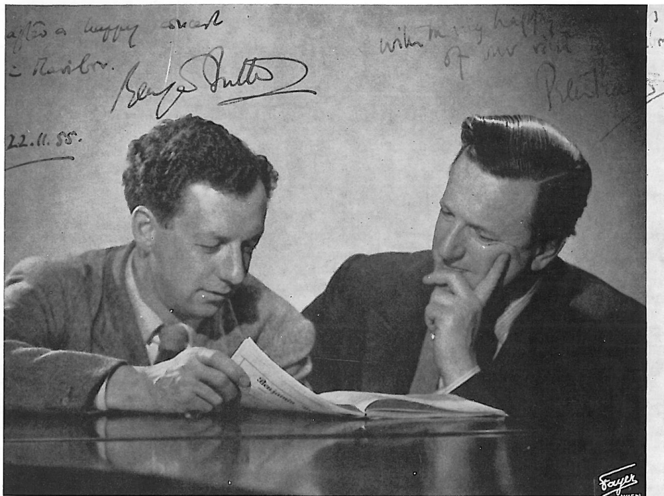
Benjamin Britten in Peter Pears Maribor 22. februarja 1955