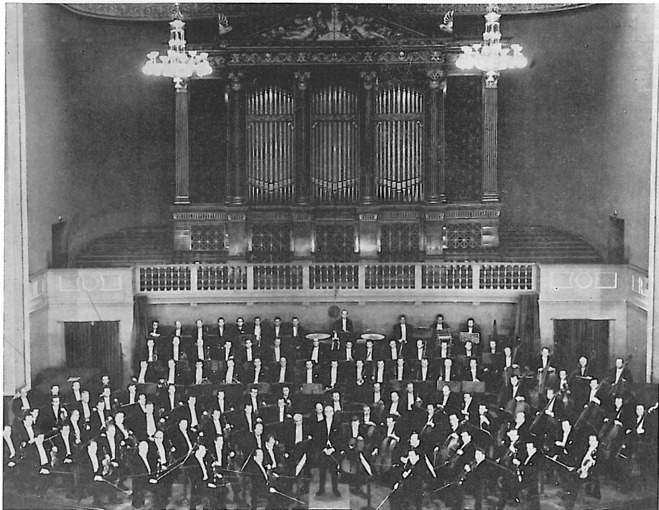
Simfonični orkester Češke filharmonije Dirigent Vaclav Neuman Bedřich Smetana — Moja Domovina