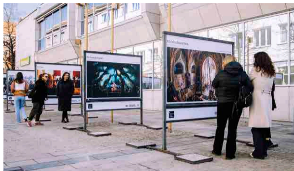
Otvoritev razstave 80 let Koncertne poslovalnice