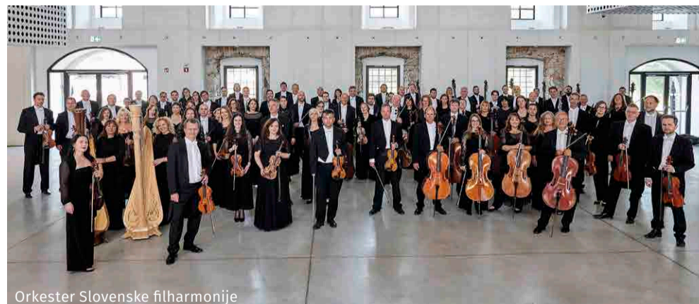
Orkester Slovenske filharmonije