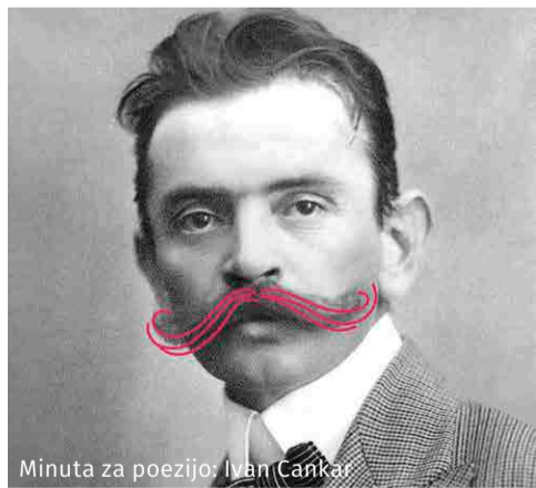
Minuta za poezijo: Ivan Cankar