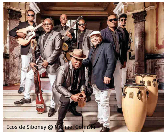
Ecos de Siboney

Ker stoji v ambientu, ki z odsevi luči v Dravi in labodi in stoletnimi zidovi kar kliče po krasnih fotkah? Itak. Predvsem pa zato, ker prinaša kuratorsko ponudbo za vse, ki od muzike pričakujete več. Recimo francosko vročico Poum Tchack, »najboljši bend na svetu, ki ga še v življenju niste slišali«. S svojo fluidno glasbeno fuzijo, v kateri se eksplozivno premešajo strastna gypsy virtuoznost, zappajevska energija in punkovska neukročnost, osvajajo svet. Osvojila vas bo tudi kubanska senzacija Ecos de Siboney, ki s svojo hipnotično Son Cubano nadaljuje dediščino legendarnega Compaya Segunda, z globalnim hitom Tengo un Son pa dokazuje, da tradicija ni le odzven preteklosti, ampak še kako tudi valilnica sodobnih glasbenih uspešnic. Iz Ženeve prihajajo mojstri hipnotičnega groova L'clair. Muzika, ob kateri hkrati plešeš in jočeš. Podobno se godi tudi ob glasbi italijanskih posebnikov Yaráká,