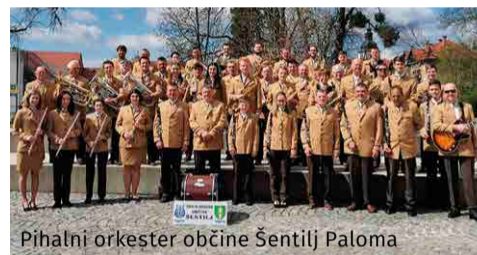
Pihalni orkester občine Šentilj Paloma

Pihalni orkester občine Šentilj, Paloma, s sedežem v Ceršaku, je dolgoletna glasbena stalnica, saj bolj ali manj neprekinjeno deluje že od leta 1933. Kot eden najpomembnejših akterjev dogajanja v občini Šentilj s svojo bogato tradicijo ter raznolikim in pestrim repertoarjem pomembno bogati kulturno krajino in življenje v tej obmejni občini.