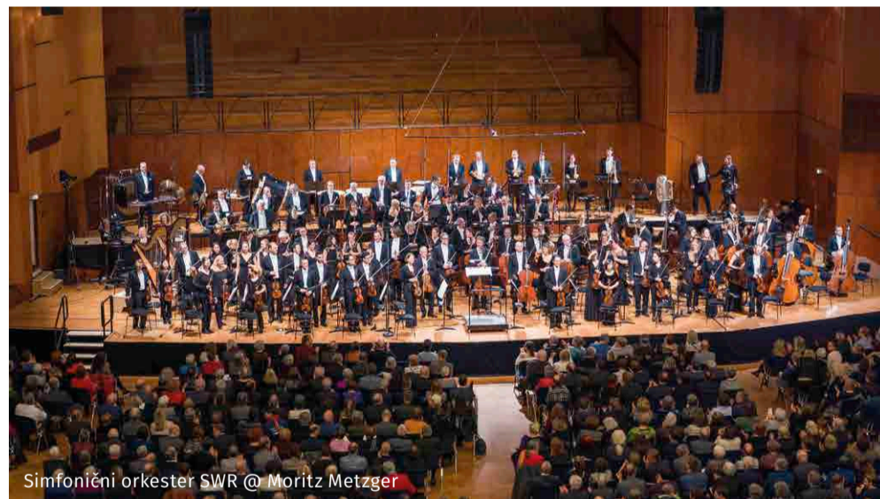
Simfonični orkester SWR

Kartica Moj izbor: ker je življenje bogatejše, če je pestro.