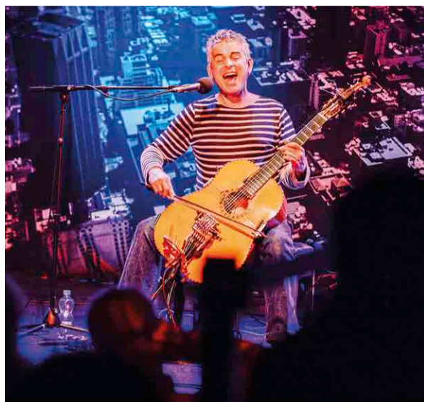
Jazz v Narodnem domu, Paolo Angeli