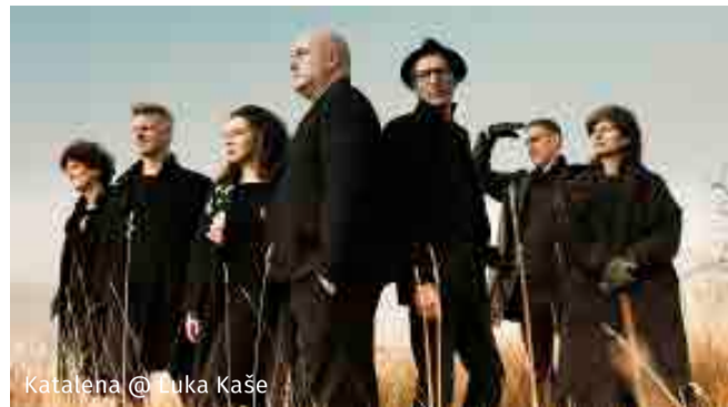
Katalena @ Luka Kaše

Kaj je najboljša stvar na Trgu najstarejše trte? Poleg najstarejše trte, seveda. Oder OTP banke!