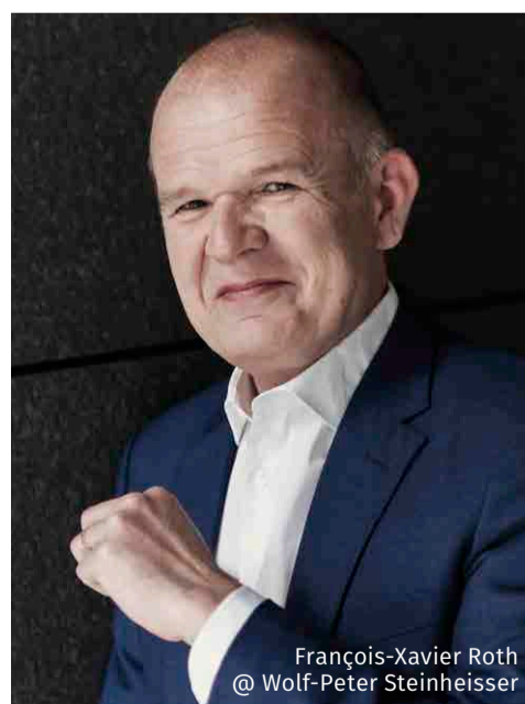
François-Xavier Roth